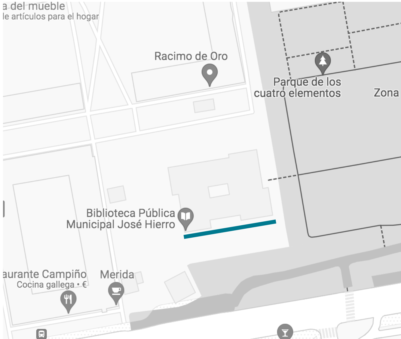
Mapa del lugar