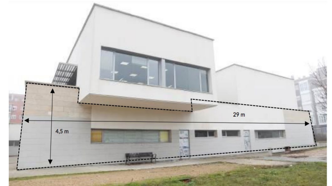
Fotografía de la pared