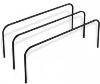
SW04 Barras Paralelas Dobles