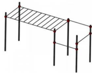
SW14 Monkey Bar