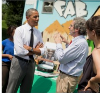
Imagen2: Maker Fair en la Casa Blanca de los Estados Unidos, 2014. Abajo a la derecha, Neil Gershenfeld con el presidente de los Estados Unidos, Barack Obama.