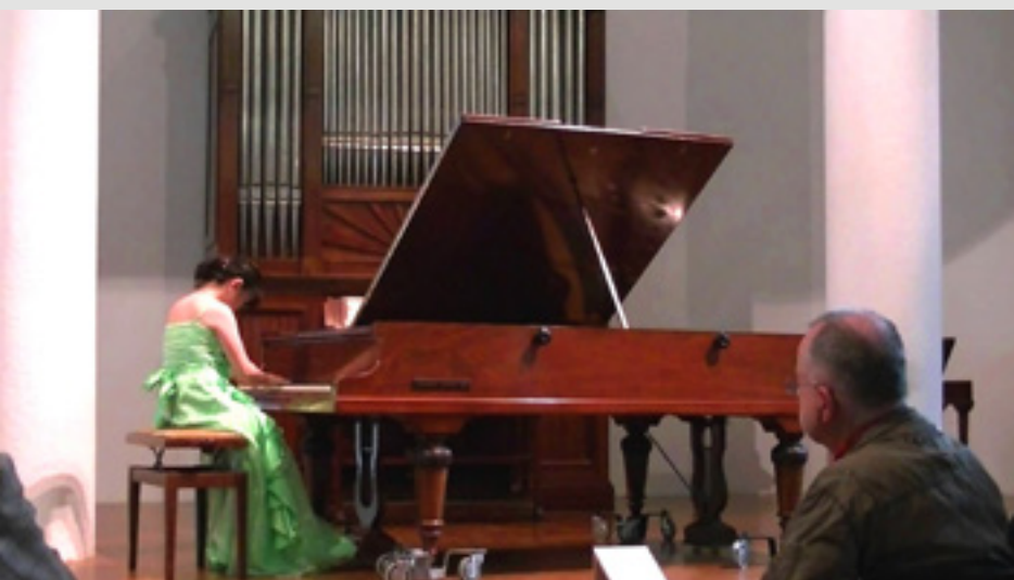
Museo de Instrumentos Musicales. Berlín Casa-Museo del Piano. Caracas Museo de Instrumentos. Bruselas Museo de Instrumentos Antiguos. Stuttgart