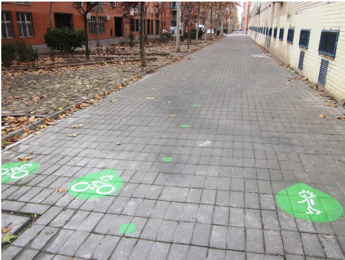
Señalización del itinerario al cole.