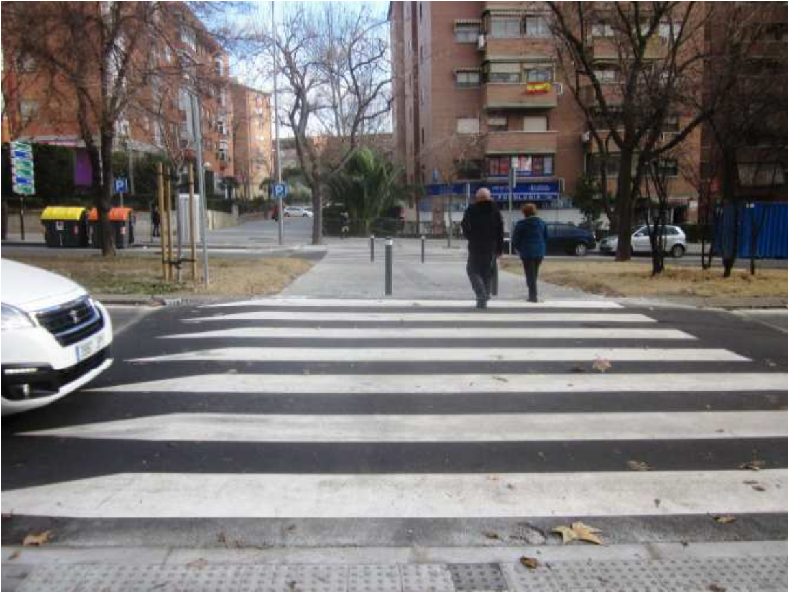
Después de la actuación. Paso de peatones elevado, construido.