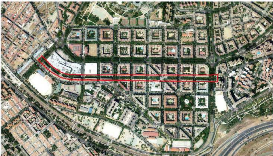
Zona de actuación

Objeto: Señalizar en el suelo un itinerario escolar a lo largo de la calle peatonal Reina de África que permita el acceso seguro, a pie o en bicicleta, a los diferentes colegios de la zona. Creación de un nuevo paso de peatones elevado en la calle Buenos Aires en su confluencia con la calle Reina de África.