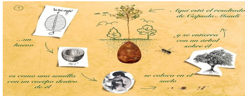
Ilustración 25. Esquema de funcionamiento de la Cápsula Mundi.