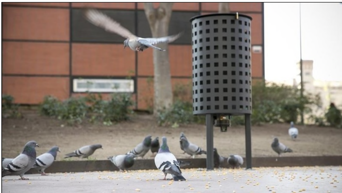
Tolva dispensadora de pienso anticonceptivo para las palomas en Barcelona:

https://www.facebook.com/eduard.monsalve.10/videos/10214870035893193/