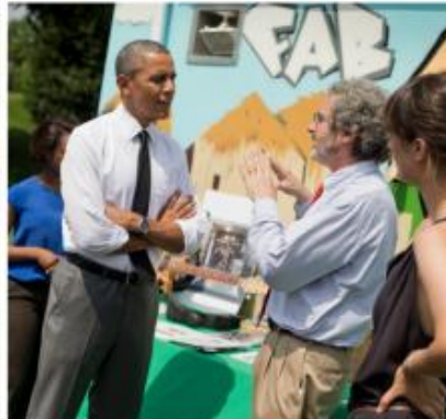
Imagen2: Maker Fair en la Casa Blanca de los Estados Unidos, 2014. Abajo a la derecha, Neil Gershenfeld con el presidente de los Estados Unidos, Barack Obama.