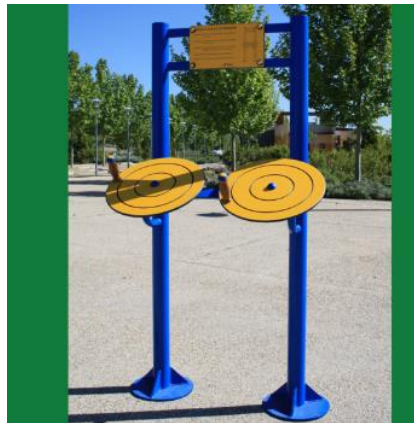
Ruedas de brazos Ortotecsa EC/11