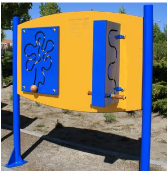
Panel de ejercicios de brazos Ortotecsa EC/4