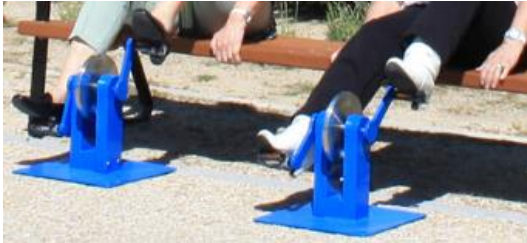
Juego de pedales Ortotecsa Modelo EC/8