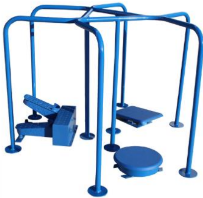
Conjunto Disco-Step-Balancín EC/12