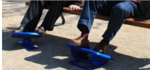
Plato circunductor EC/10