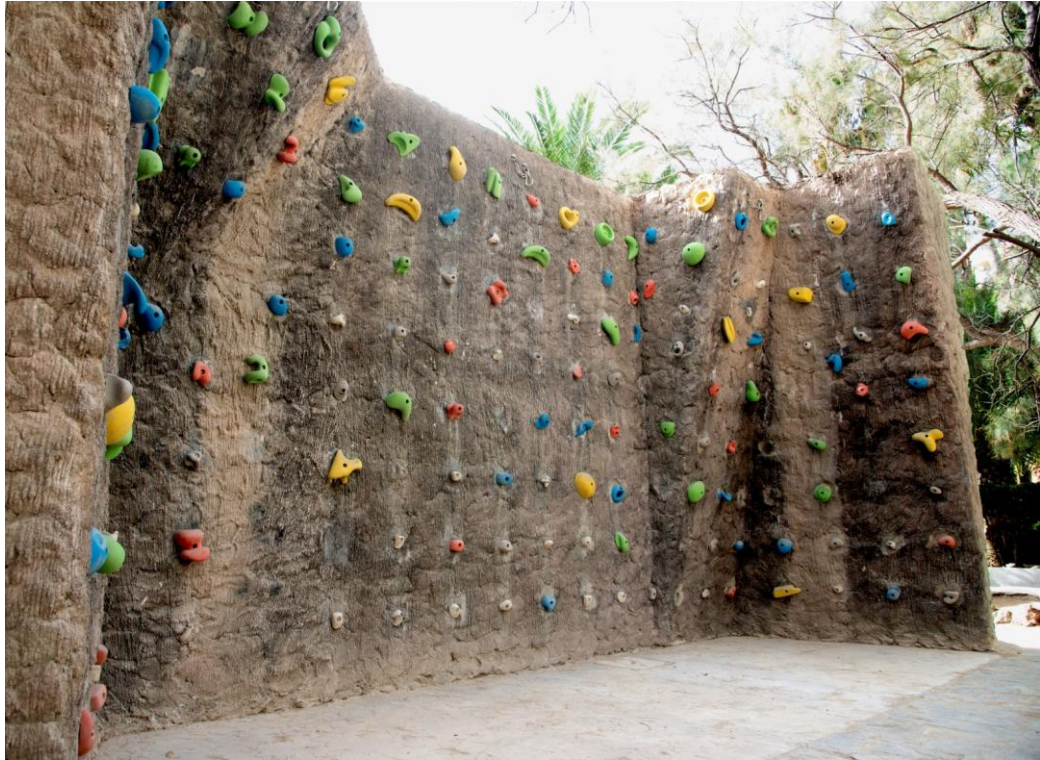
*Ejemplo de propuesta de rocódromo