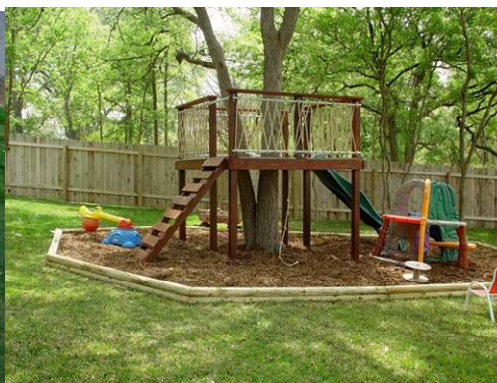
4 Elemento en árbol con suelo de corteza de pino