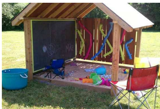
1 Arenero Techado

Imprescindible poner algún techado para inclemencias.