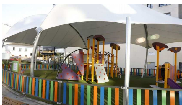
2 Parque Techado

En la medida de lo posible que sean diseñados por personas especializadas en infancia y que tengan en cuenta sus necesidades según perspectivas de edad y género (convivencia entre bebés, mayores que utilizan los elementos, otros que juegan con pelotas, las que pintan en el suelo etc.)