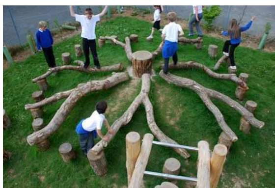
3 Área con césped y troncos

En la medida de lo posible que sean diseñados por personas especializadas en infancia y que tengan en cuenta sus necesidades según perspectivas de edad y género (convivencia entre bebés, mayores que utilizan los elementos, otros que juegan con pelotas, las que pintan en el suelo etc.)