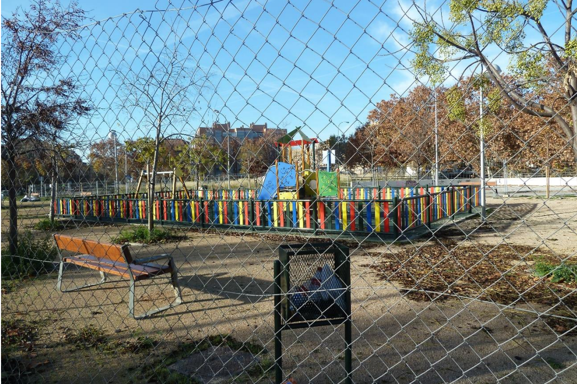
4 - Parque infantil situado en la calle Garganta de los Montes en su confluencia con la calle Méndez Álvaro y la calle Comercio, frente a la plaza del Amanecer en Méndez Álvaro (barrio de Atocha)