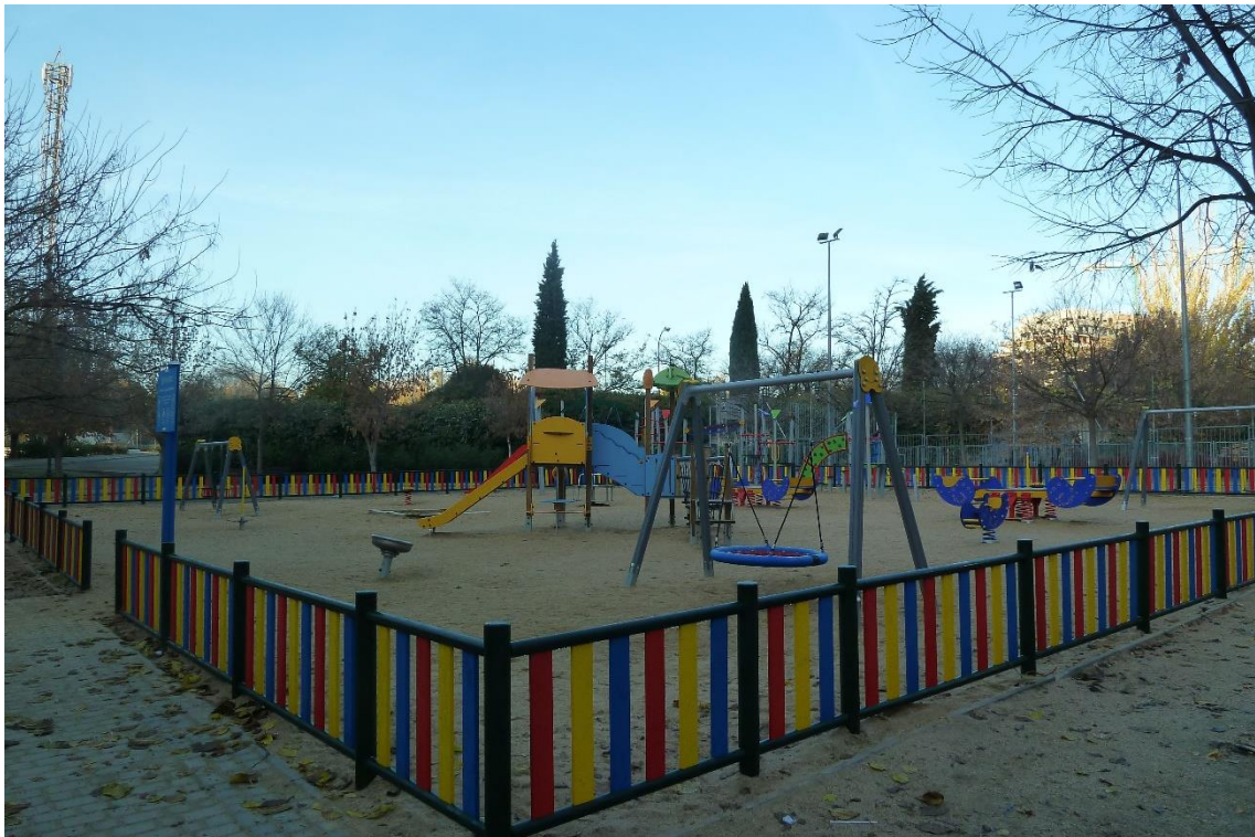
1 - Parque infantil situado en la confluencia de las calles Eros y Ariel, en las proximidades del planetario y de la nueva escuela infantil -en construcción- (barrio de Legazpi)

(N. del A.: Las fotografías están tomadas entre las 9 y 10 de la mañana del lunes 10 de diciembre de 2018. Por este motivo, no se ve una adecuada insolación o luz sobre algunos de los parques infantiles, mostrando en ellos una zona de sombra debida a la baja o nula incidencia de los rayos solares sobre ellos)