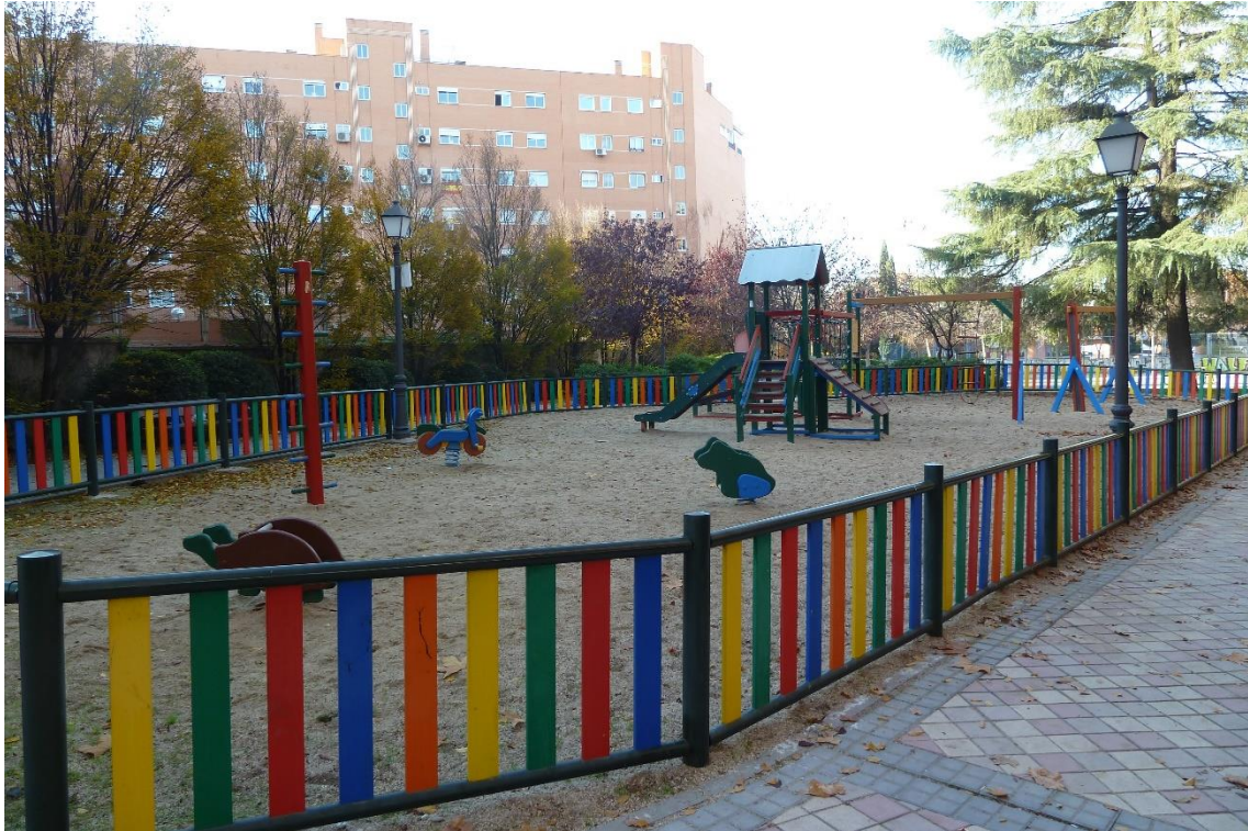
6 - Parque infantil situado frente al número 7 de la calle Ramírez de Prado, en la confluencia con la calle Juan de Mariana (barrio de Delicias)