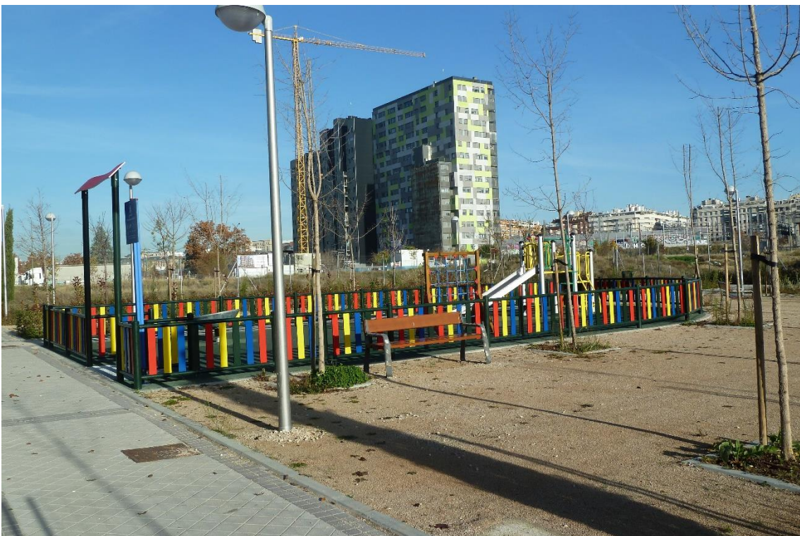
3 - Parque infantil situado frente al número 44 de la calle Méndez Álvaro, en la acera de los impares, en la confluencia con la calle Alpedrete, delante de la sede de Repsol (barrio de Atocha)