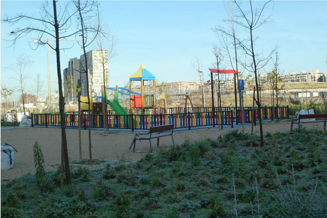
2 - Parque infantil situado en la calle Méndez Álvaro, en la acera de los impares, junto a la boca de metro, frente al número 64 de dicha calle (barrio de Atocha)