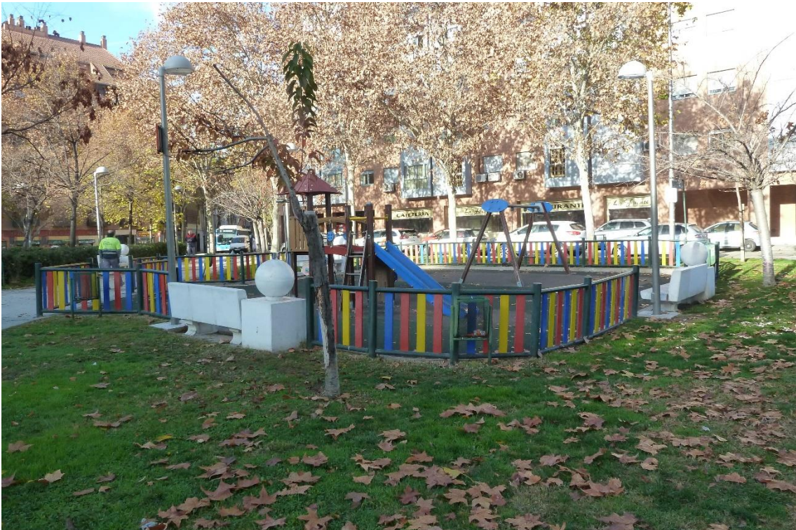
5 - Parque infantil situado en la plaza del Amanecer en Méndez Álvaro (barrio de Delicias)