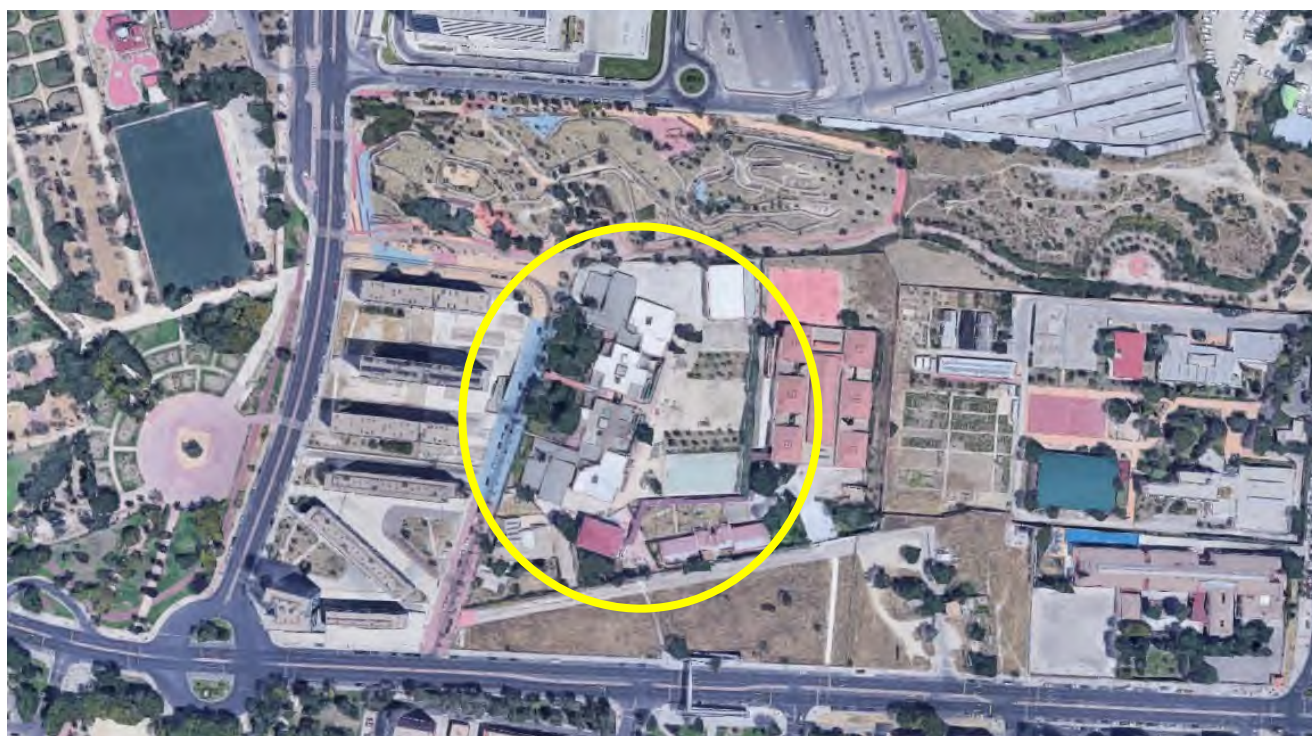
Imagen 1-Localización del CEIP Ciudad de Jaén

El CEIP Ciudad de Jaén se encuentra en la calle Madre Rosa Blanco nº 3, 28041 Madrid en el Barrio de Orcasur del Distrito de Usera.