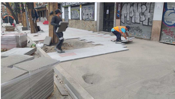
Fotografía 4.- Calle Castrojeriz entre Nº 12 y Nº 10: Colocación de las baldosas sobre capa de asiento.

En la visita realizada el día 22/04/2020 a la obra, en la Avda. Plaza de Toros se inicia la colocación de las alineaciones de bordillos en la acera de los números pares. En la calle Castrojeriz, continúan los trabajos de solado en el tramo desde el Nº 12 al Nº 10 mientras que, desde el Nº 8 al Nº6 se realizan trabajos de demolición del pavimento y bordillos del acerado.