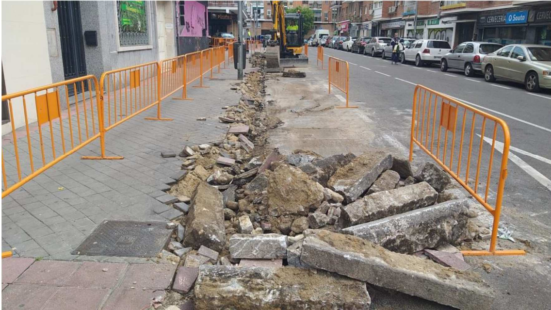
Fotografía 5.- Calle Castrojeriz entre Nº 8 y Nº 6: Levantado de bordillo y demolición de acerado.