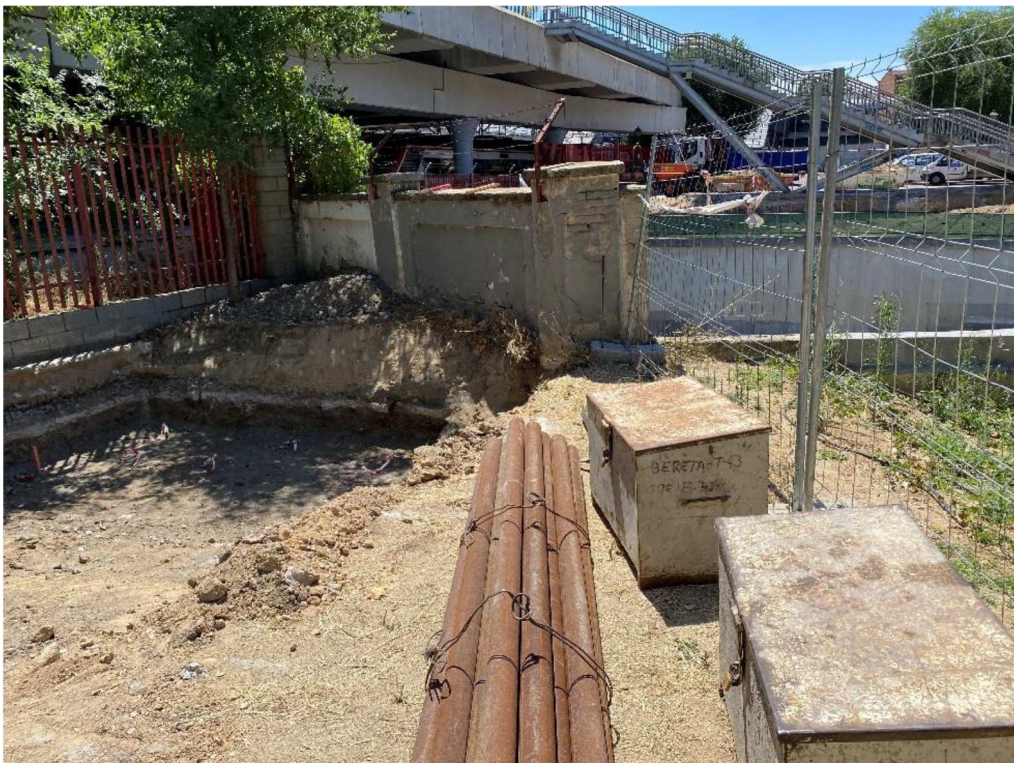
Foto 4: Preparación del terreno para la realización de micropilotes de la pasarela metálica