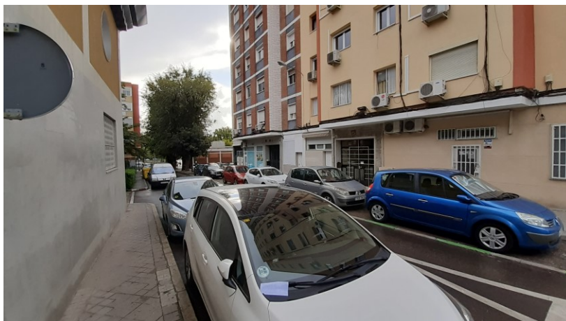
Acera muy estrecha

El gran problema de la plaza de Almuñécar es el escaso espacio para los viandantes, con aceras que no superan 1,5 metros en uno de los lados y en el otro, jalonadas por árboles cuyas raíces producen un suelo desnivelado.