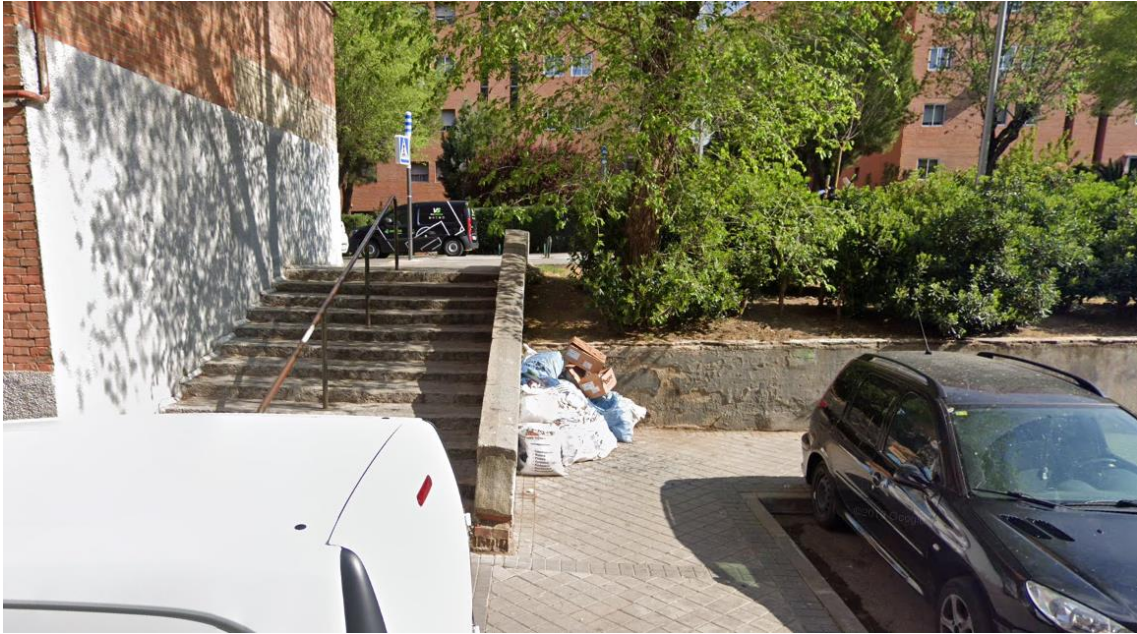
Acceso López Grass con Camino Valderribas.