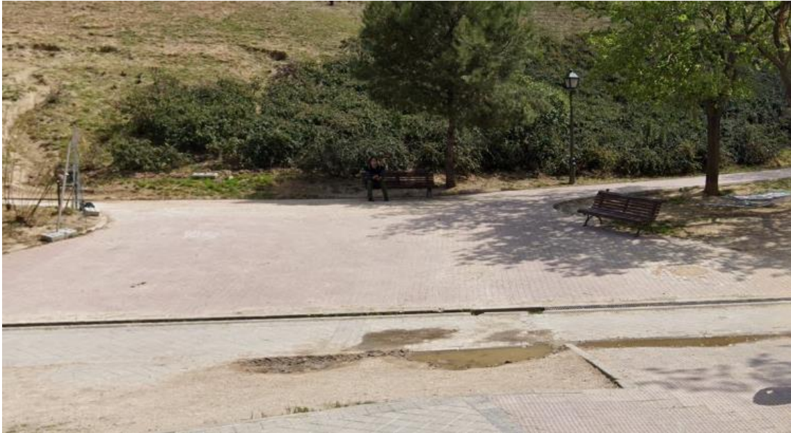
Acceso Parque Cerro Tío Pío desde Camino Valderribas.