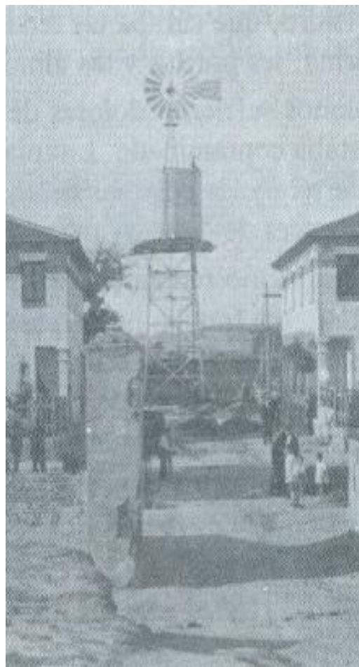
Colonia Hogar del Ferroviario