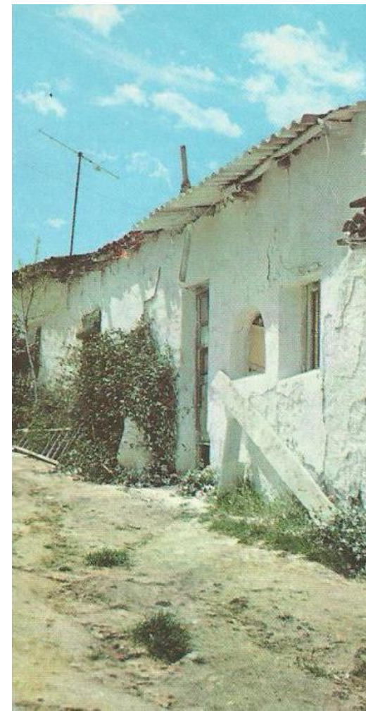
Poblado de El Torito (años 80)