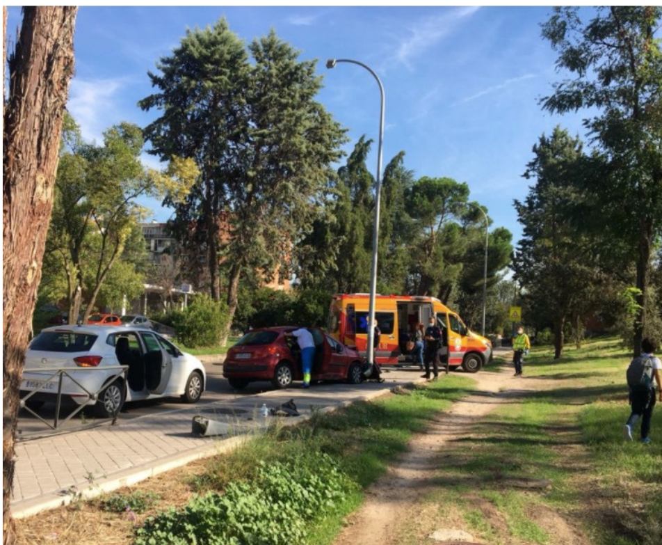
Foto de accidente de tráfico ocurrido en la Avenida Veinticinco de Septiembre el día 27 de septiembre de 2021.