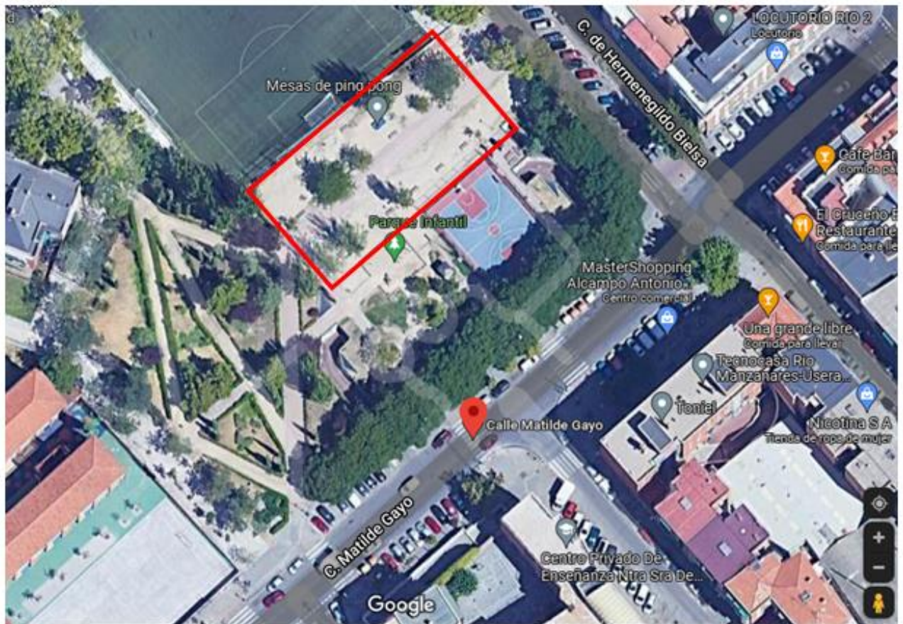
Vista de parque y en color rojo zona solicitada para intervención.