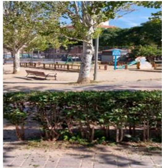
Únicos muy antiguos y escasos aparatos infantiles.