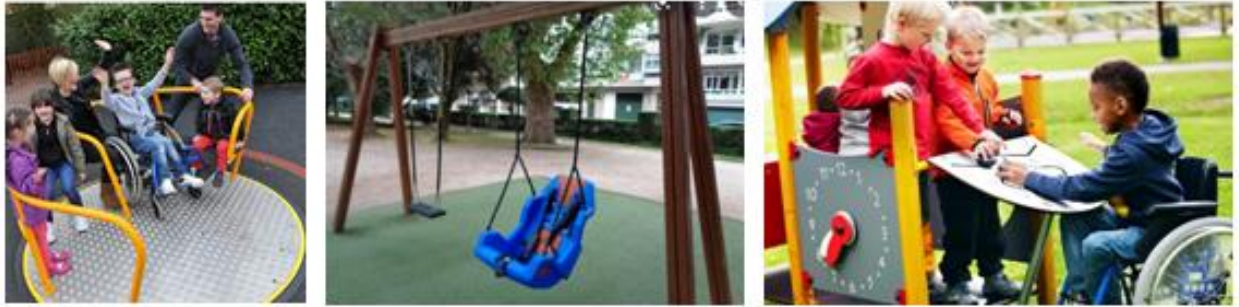
Diversos ejemplos de equipación infantil inclusiva.