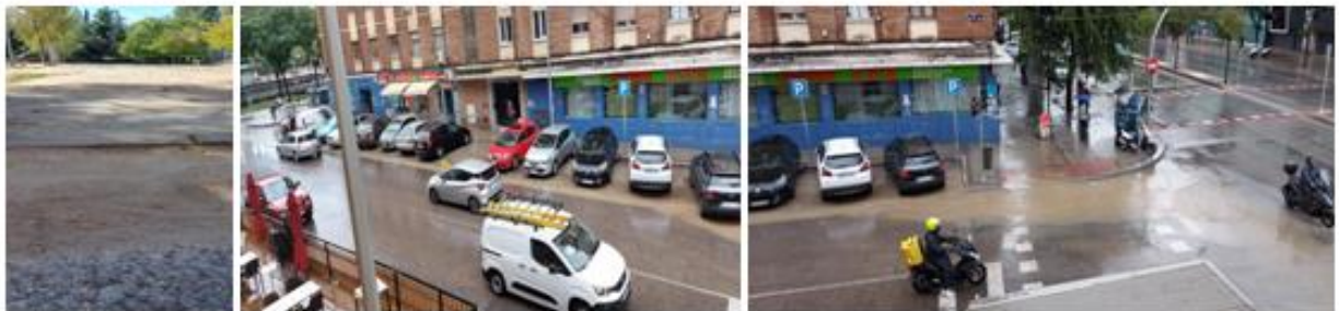
Problemas de tierra que invade la calzada y las consecuencias de atascos de agua por el barro.