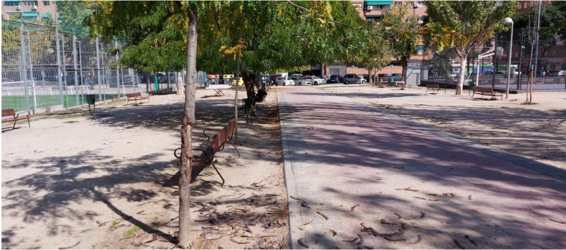
Vista de la zona concreta donde se pide intervención.