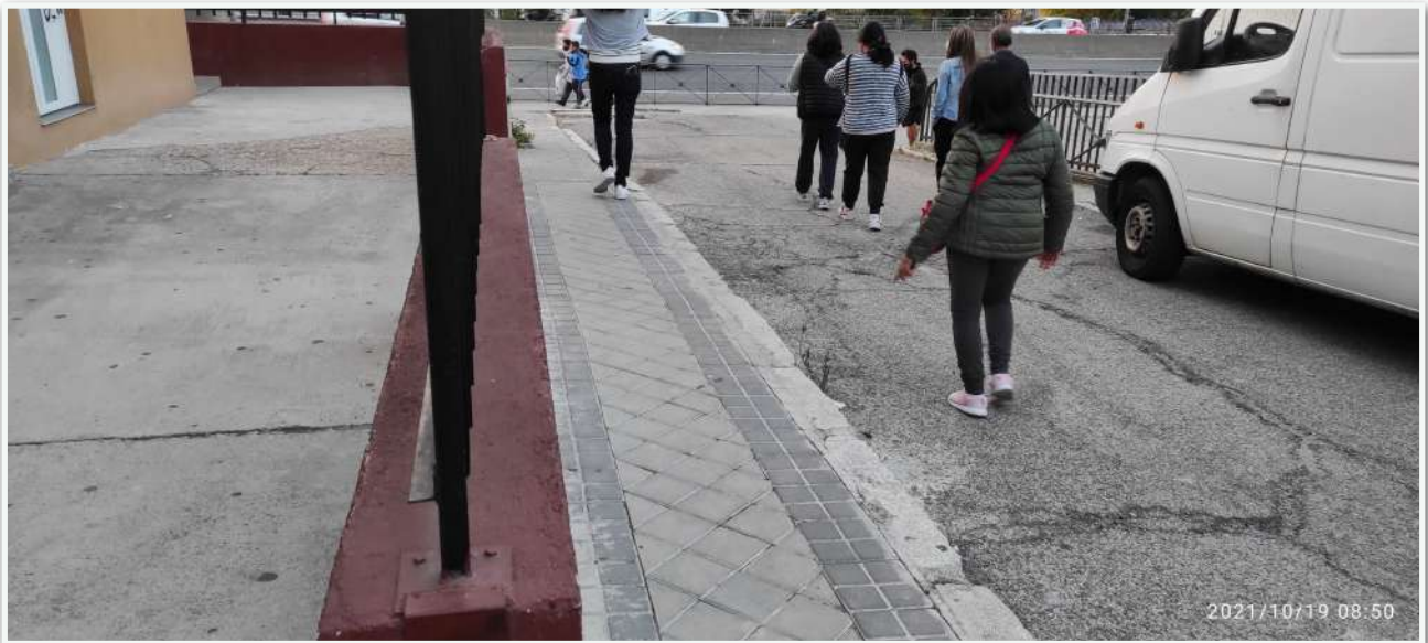
ACERAS ESTRECHAS, ASFALTO EN MAL ESTADO, COCHES EN DOBLE FILA, ACERA DEL OTRO LATERAL TESTIMONIAL A RAS DE CALZADA.