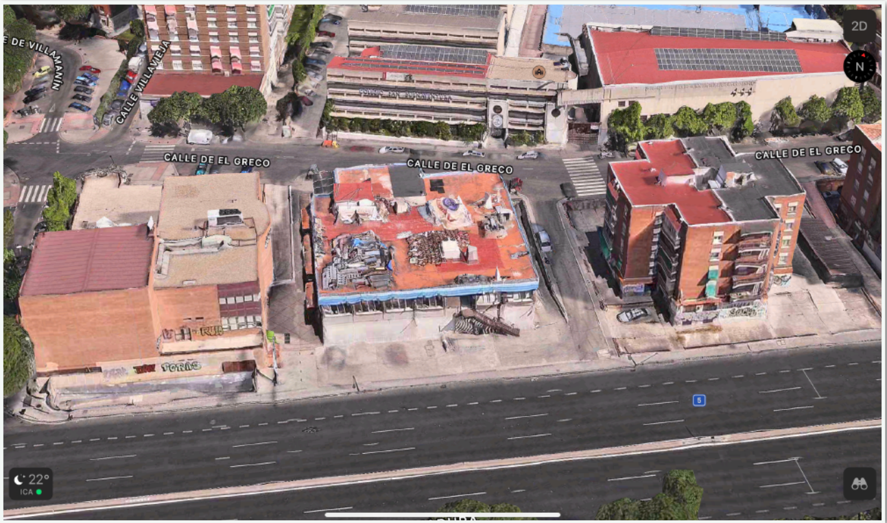
ENTORNO COLEGIO SAN BUENAVENTURA DE MADRID Calle de el Greco, 16 28011 Madrid España, 40,40763° N, 3,74700° O