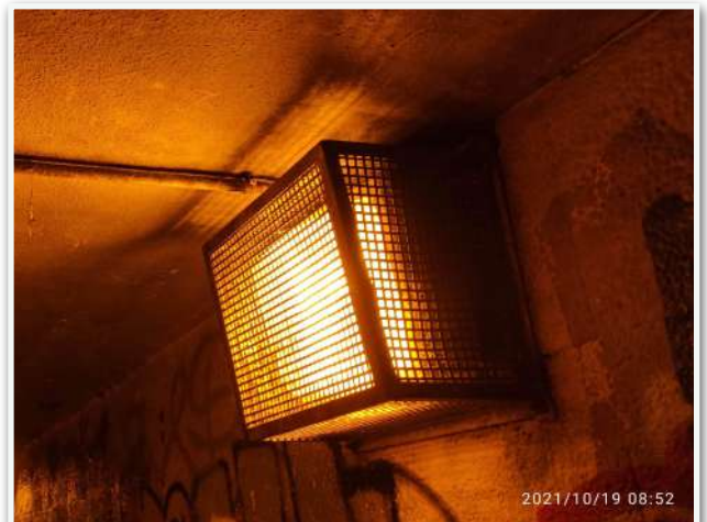
DETALLE DE ILUMINACIÓN DEL TÚNEL