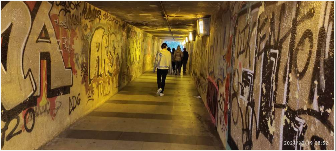
TUNEL DE ACCESO ENTRE C/ EL GRECO Y C/OLIVILLO. ZONA DE TRÁNSITO DE NIÑOS Y MAYORES. OSCURO, FRÍO Y HÚMEDO. APORTA SENSACIÓN DE INSEGURIDAD AL BARRIO, EVITA AUTONOMÍA DE LOS VECINOS.