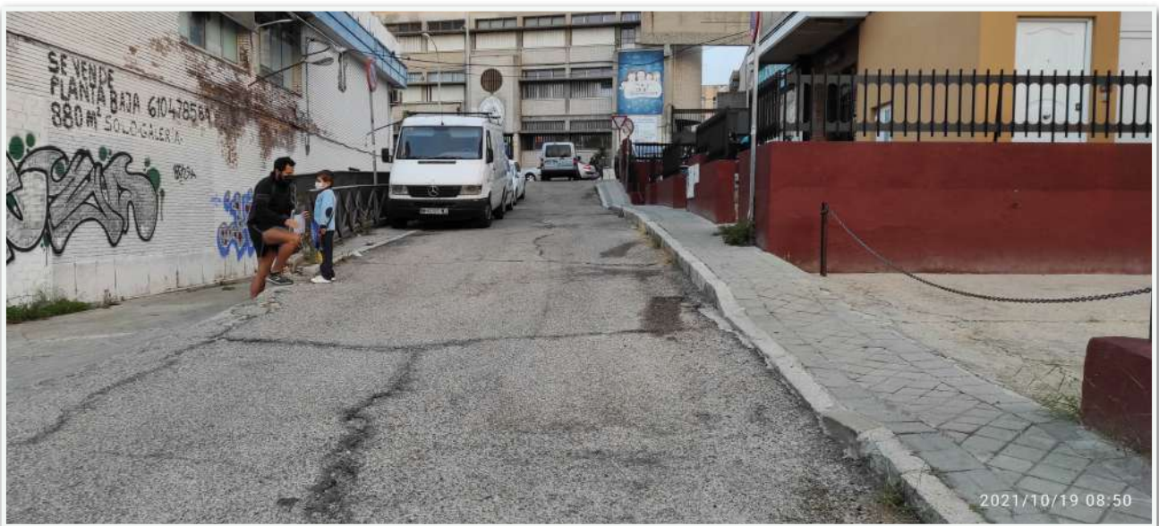
CAIDAS A DISTINTO NIVEL