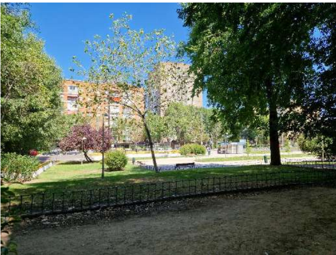
33. Plaza Corregidor Lic Antonio de Mena