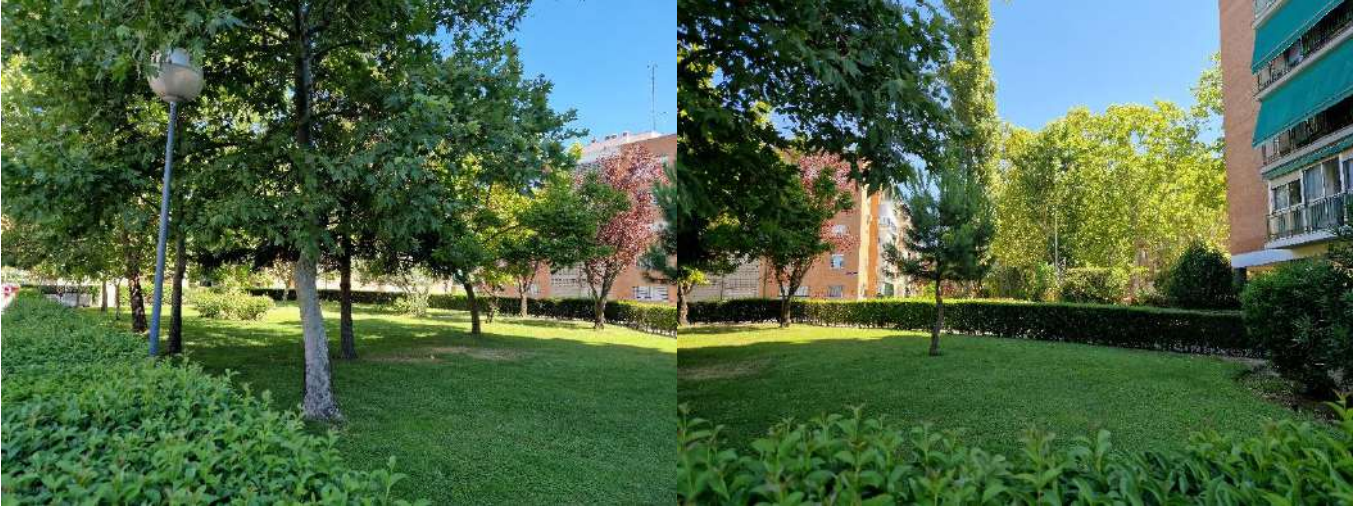
26 y 27. Jardines ubicados en Pico de los Artilleros 67