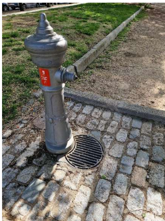
23. Fuente ubicada en Zona verde situada entre A-3 y Calle Arroyo Fontarrón