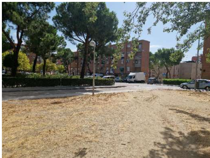
14. Junto a Arroyo Fontarrón 329