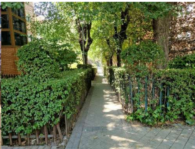
43. Junto a Pico de los Artilleros 114