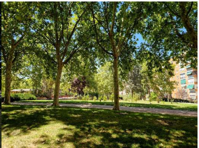
34. Parque Moratalaz (Avenida de Moratalaz)