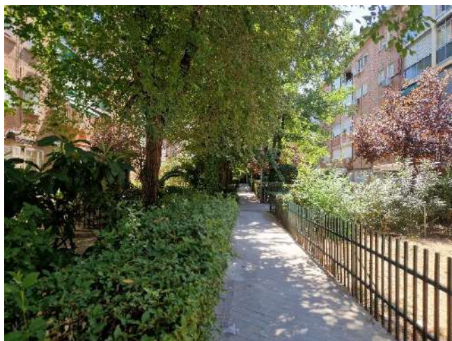
42. Junto a Camino de los Vinateros 159