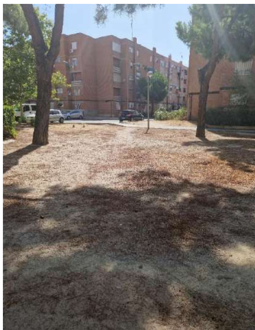
9. A un lado de Calle Arroyo Fontarrón 437