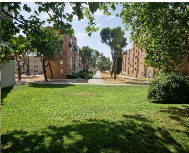
8. Junto a Encomienda de Palacios 268