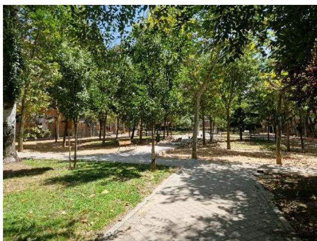
44. Junto a Hacienda de Pavones 206