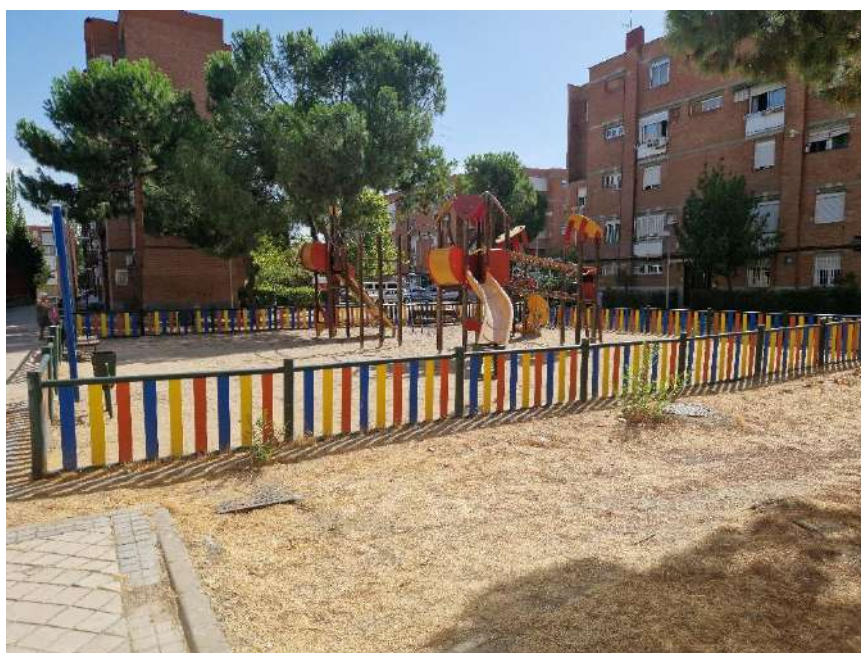
18. Parque Infantil 14002, en Arroyo Fontarrón Arroyo 417