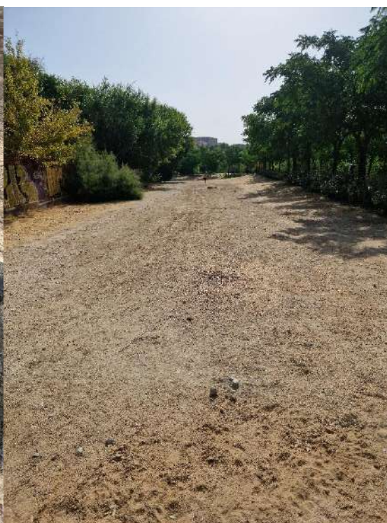
24. Terreno baldío o sin uso detrás del Colegio Público Fontarrón, junto al anillo verde ciclista.