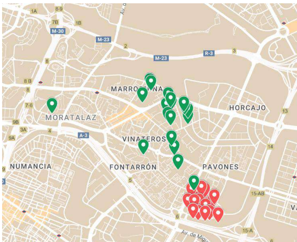
46. Ubicación de las imágenes presentadas

Las problemáticas identificadas a lo largo de este documento han surgido especialmente por la dejadez y falta de prioridad de este sector y no tanto por falta de recursos. En este sentido me gustaría incidir nuevamente en como esta zona se ha dejado de lado en favor de otras más céntricas a nivel del distrito, tal y como se puede observar en la imagen 46 . En ella podemos ver la ubicación de todas y cada una de las imágenes que he tomado para la elaboración de este documento. En rojo las imágenes donde se han identificado problemáticas, principalmente en el sector; y en verde aquellas zonas que pueden servir de ejemplo, especialmente repartidas por el resto del distrito. Quiero aclarar que esto no significa que los problemas o deficiencias solo estén en el sector de estudio.