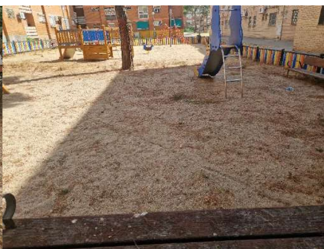
17. Parque Infantil de Arroyo Fontarrón Arroyo 367