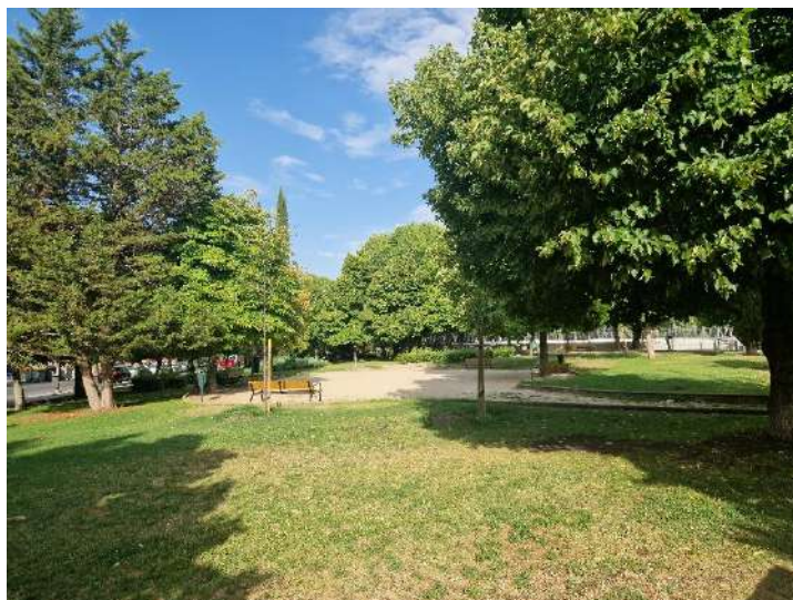
25. Parque del ANFEVI, ubicado cerca de Calle Hacienda de Pavones 174