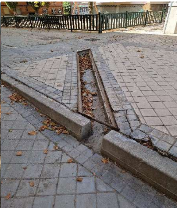
10. Parte trasera Calle Arroyo Fontarrón 403