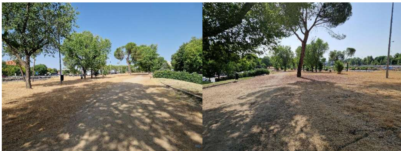
19, 20, 21 y 22. Zona verde situada entre A-3 y Calle Arroyo Fontarrón