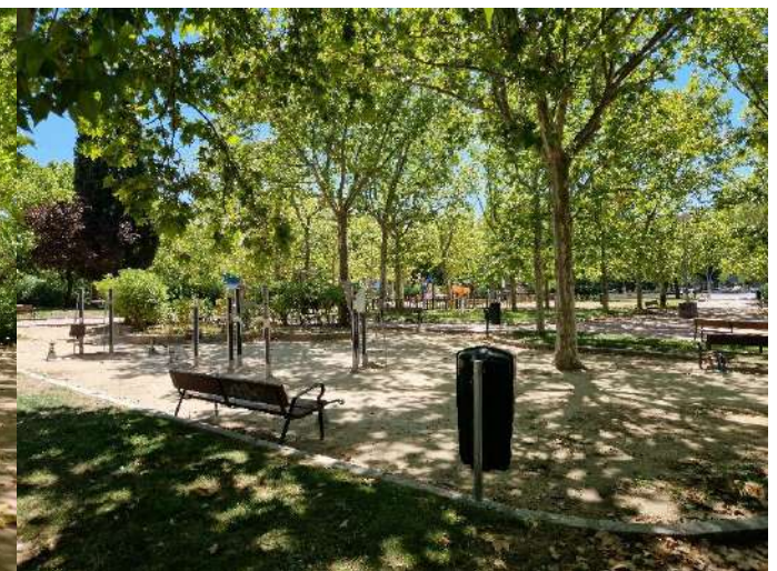
35 y 36. Parque Moratalaz (Avenida de Moratalaz)