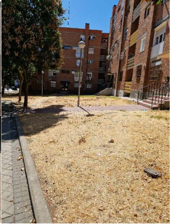
12. Junto a Encomienda de Palacios 320