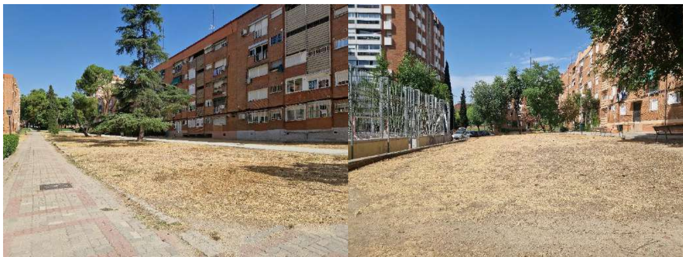
5. Parte trasera de la Calle Arroyo Fontarrón 335 - 341