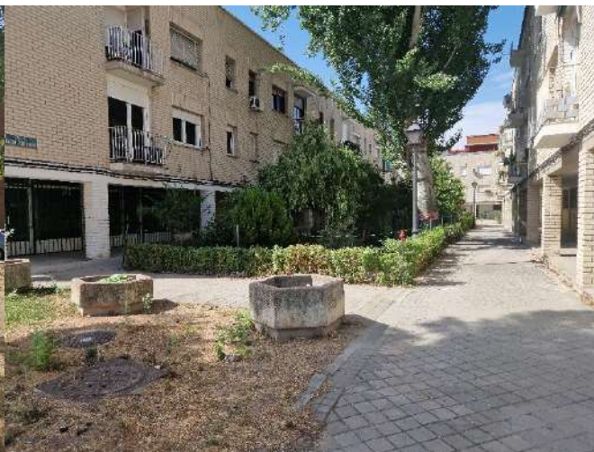
15. Junto a Arroyo Fontarrón 373