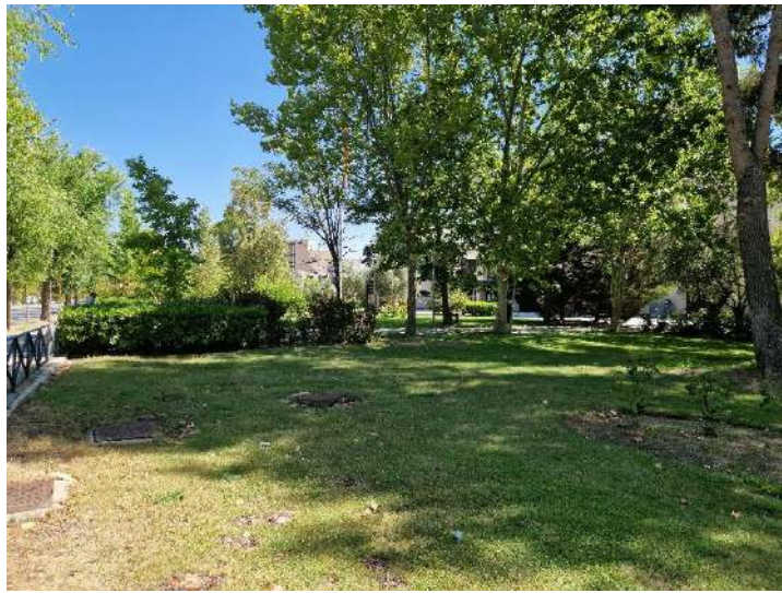
28. Jardines de la Junta Municipal de Moratalaz en Calle Fuente Carrantona 8