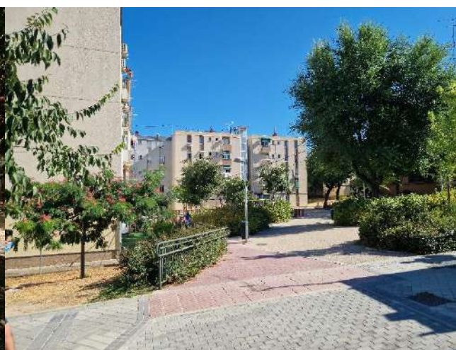
45. Junto a Avenida de Moratalaz 21