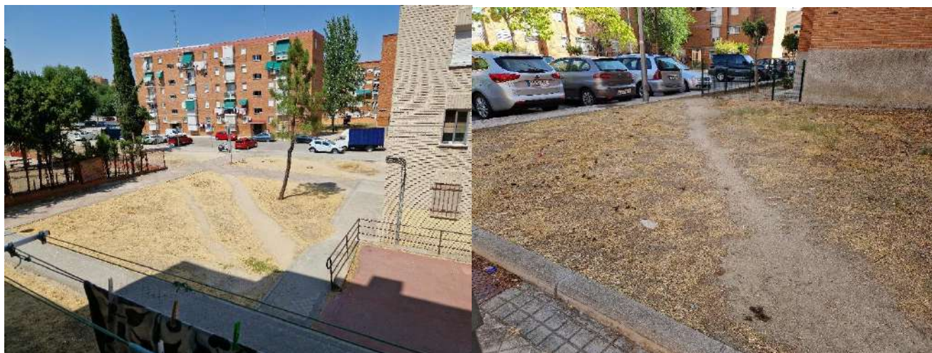
1. A la altura de Calle Encomienda de Palacios 340