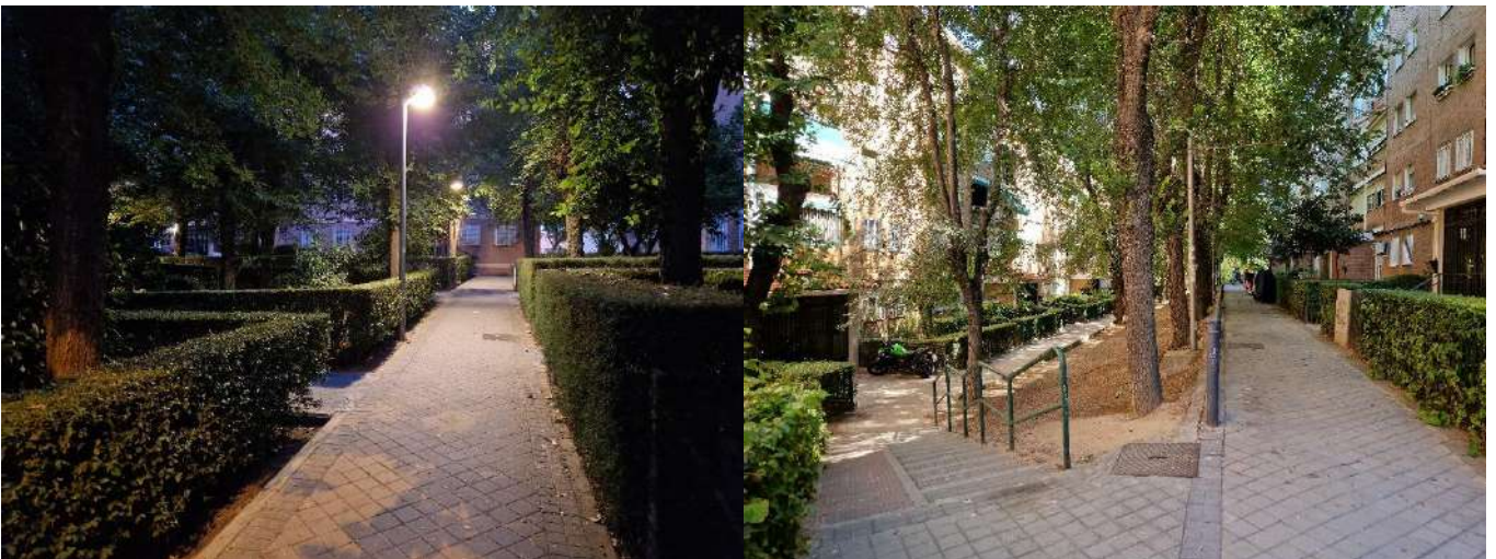
29. Junto a Hacienda de Pavones 86