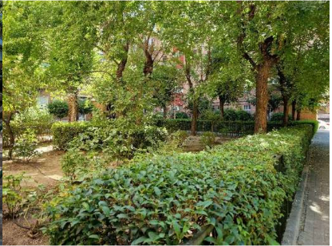
32. Junto a Pico de los Artilleros 34