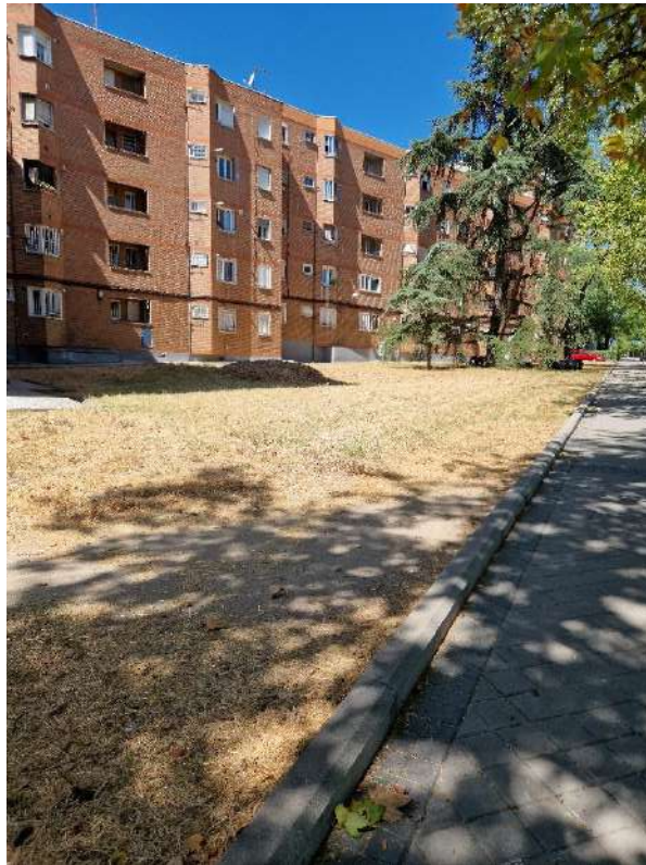
13. Junto a Encomienda de Palacios 310