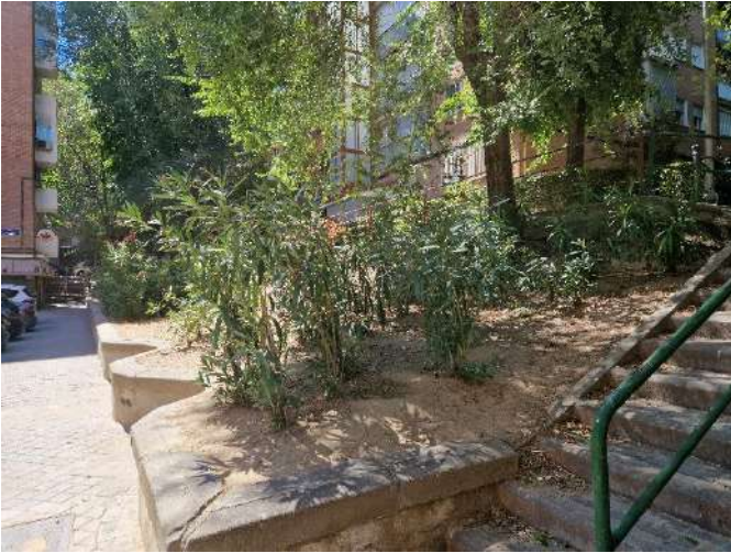
31. Junto a Pico de los Artilleros 36