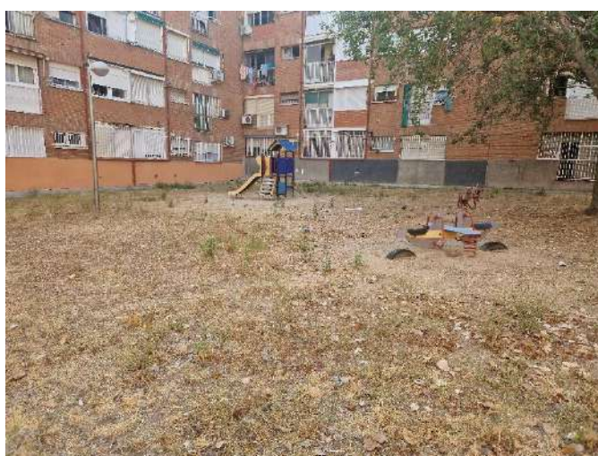
16. Parque infantil de Encomienda de Palacios 368