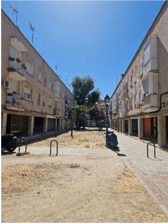
11. Cerca de Encomienda de Palacios 340