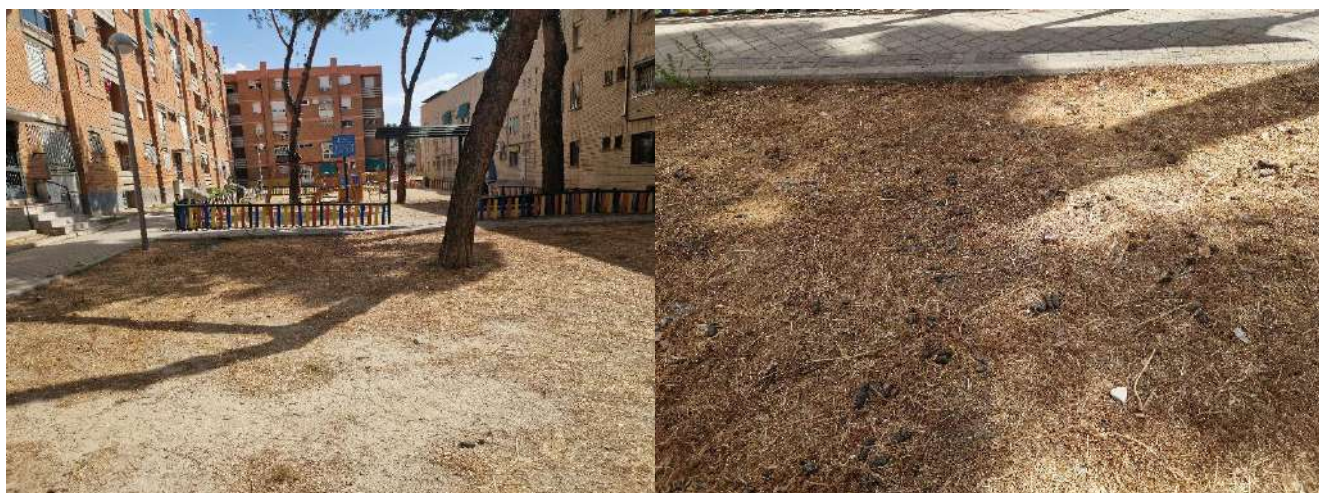
3 y 4. Parte trasera de la Calle Arroyo Fontarrón 367