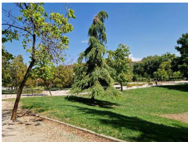
37, 38, 39, 40 y 41. Jardín de Dionisio Ridruejo (Calle Molina de Segura 4)