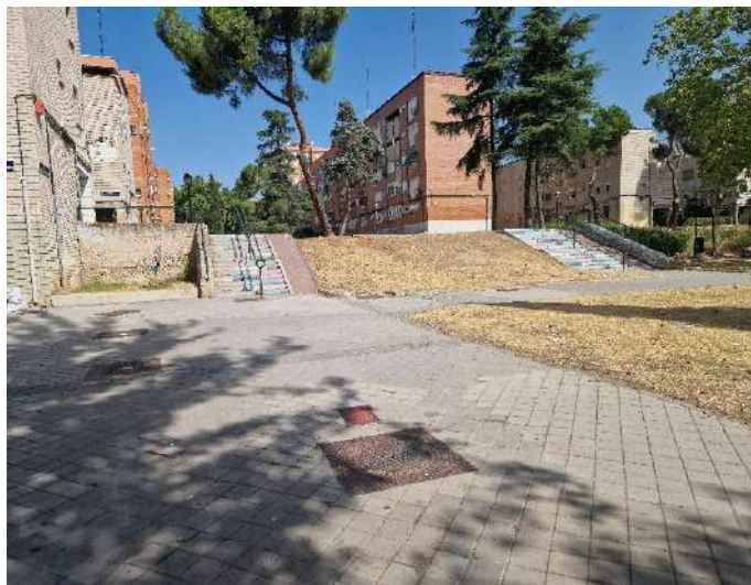
7. Junto a Calle Arroyo Fontarrón 379