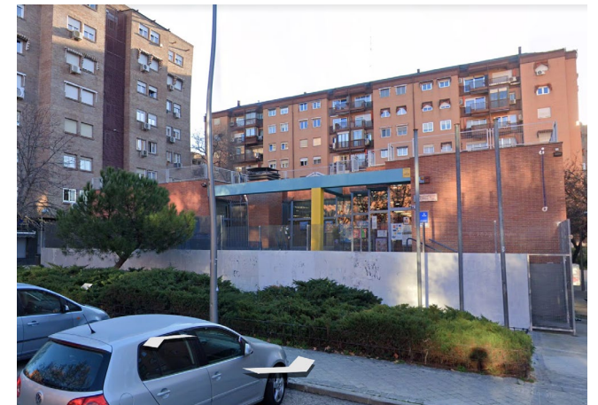
Fotografía de la pared