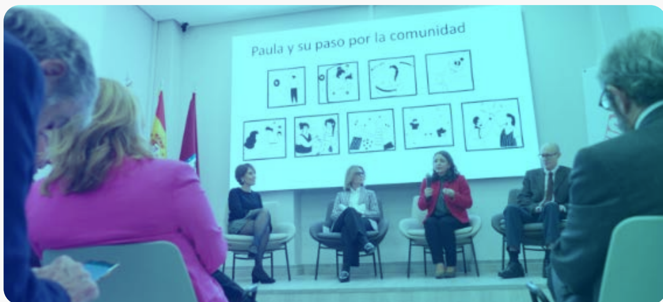
Acto de presentación de los resultados del Proyecto Thivic.

En septiembre de 2024 hemos iniciado una nueva etapa de THIVIC para mantener el laboratorio y desarrollar las líneas de actuación.