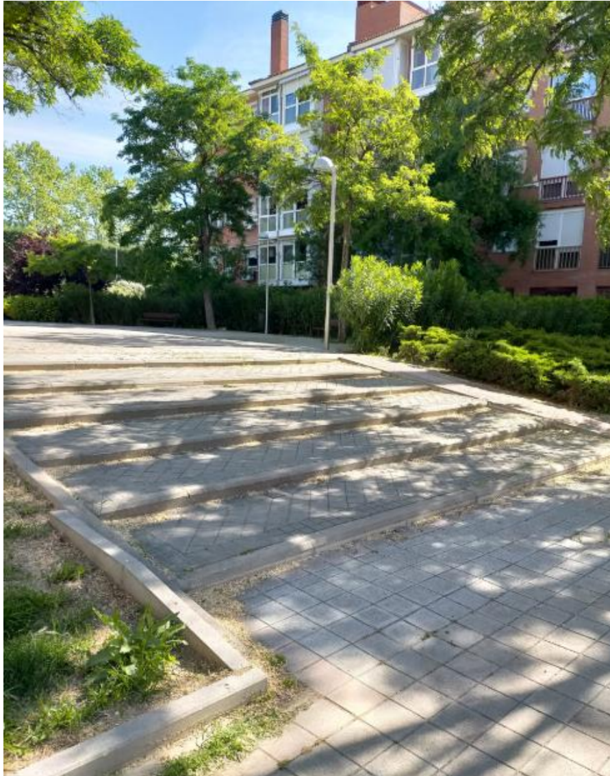
Imagen nº 5: Escalones y rampa lateral que incumple las condiciones mínimas de accesibilidad universal.

Algunos recorridos aparentemente accesibles tienen continuidad mediante rampas mal constituidas y deficientemente señalizadas. En los accesos por escaleras (también mal configurados) no existe señalización sobre la situación de los itinerarios accesibles, como se puede apreciar en las imágenes nº 5, nº 6 y nº 7.