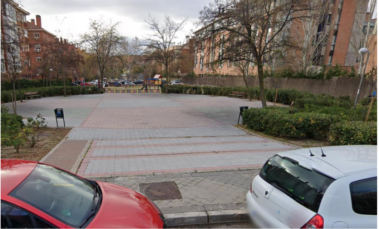
Imagen nº 6: Escalones y rampa lateral que incumple las condiciones mínimas de accesibilidad universal en acceso por c/Ramón Power.