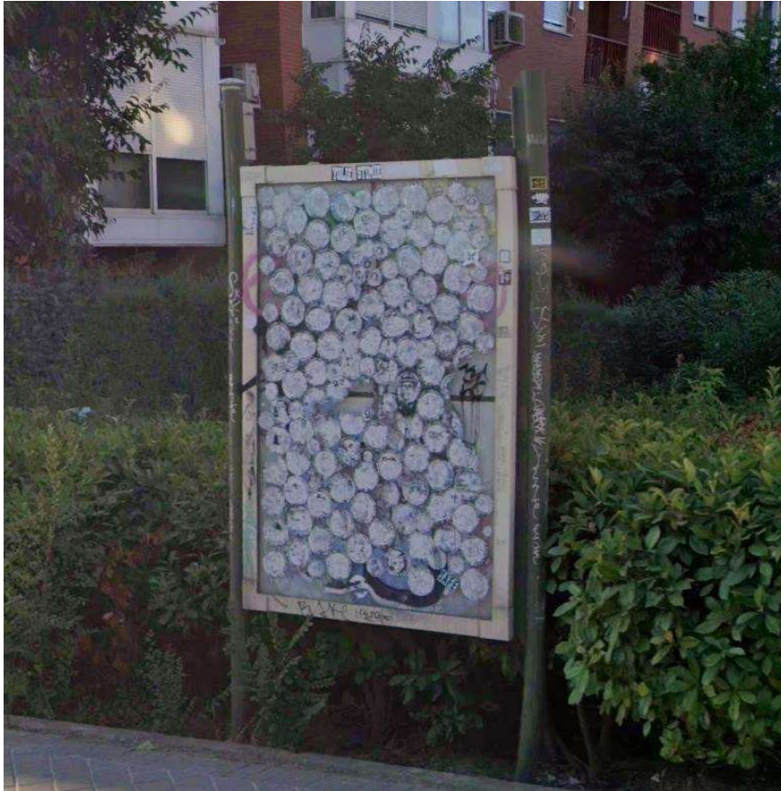
Imagen nº 4: Cartel señalizador del área recreativa totalmente deteriorado e inservible situado en c/Ramón Power.