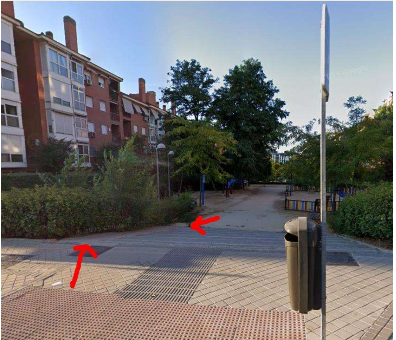
Imagen nº 3: Escalones y rampa lateral que incumple las condiciones mínimas de accesibilidad universal en acceso por c/Ramón Power.

De igual forma, tampoco están correctamente señalizados los itinerarios peatonales accesibles del área recreativa al completo, y no se ofrece información para la orientación y localización de los accesos, las instalaciones, las actividades y los servicios disponibles, sin especificación de ubicación de los juegos infantiles y sus distancias. Se muestra en la siguiente imagen el único cartel señalizador de este tipo: