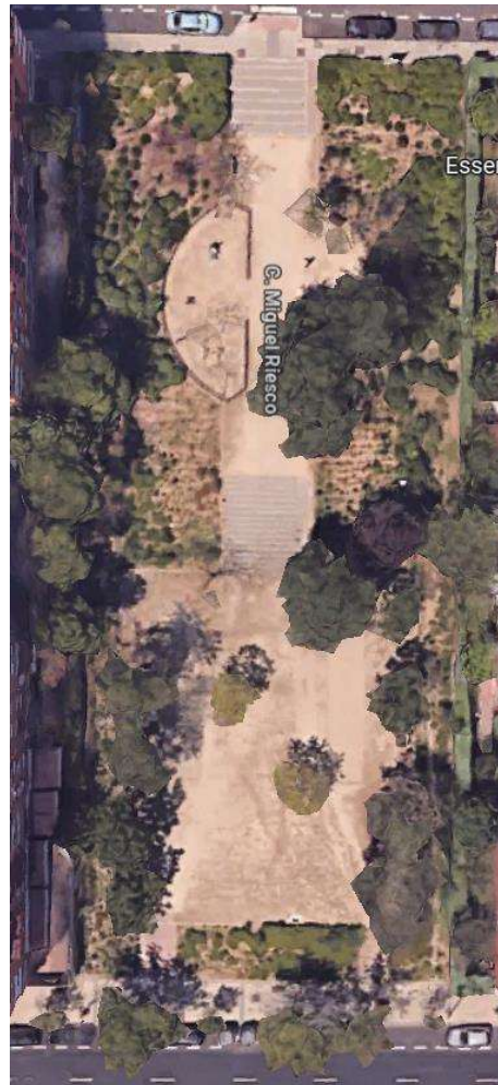
Imagen nº 1: Imagen aérea del área recreativa.

Este área recreativa infantil ubicado en el barrio residencial madrileño de Canillas y próximo a numerosos equipamientos sociales, no cuenta con las adecuadas condiciones de accesibilidad universal incumpliendo en algunos aspectos la normativa en vigor y discriminando así a las personas con discapacidad en su uso. Además, a este parque infantil acuden diariamente personas vulnerables, entre ellas, menores con discapacidad y gente de avanzada edad.